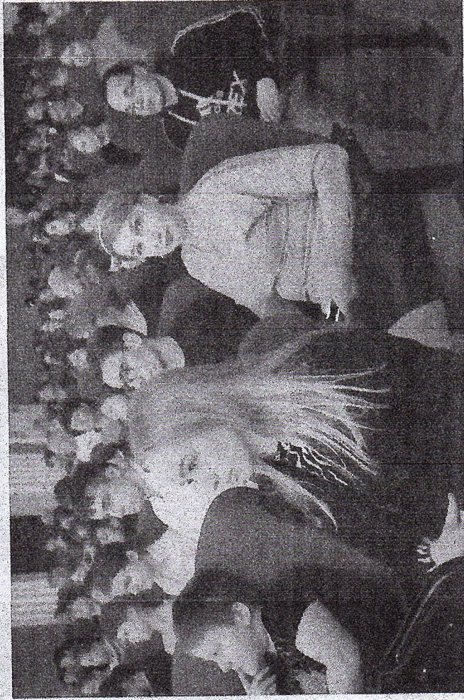
Зрители первого показа в кинотеатре «Родина».

Новолешковский ДК вошёл в число победителей конкурсного отбора Федерального фонда социальной и экономической поддержки отечественной кинематографии (Фонд кино) для предоставления средств на создание условий для показа национальных фильмов в населённых пунктах Российской Федерации с численностью населения до 500 тысяч человек.