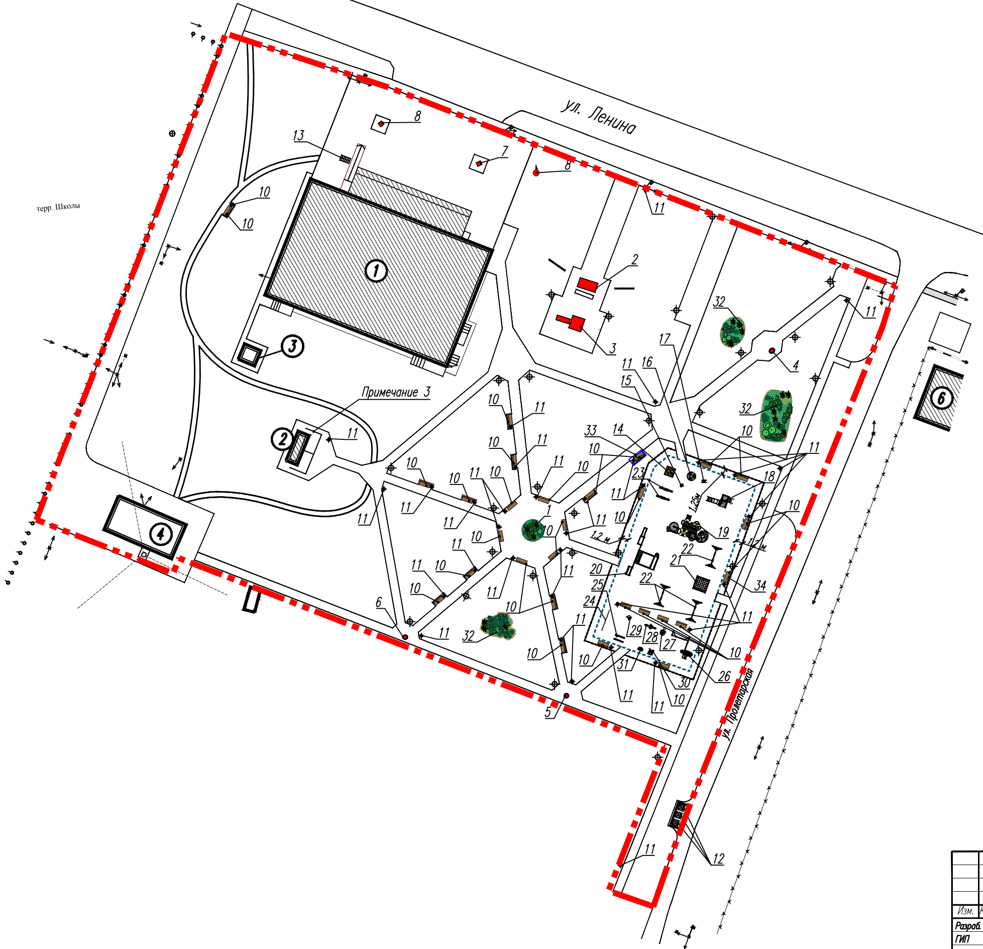
План расстановки малых архитектурных форм и оборудования площадок М1:500